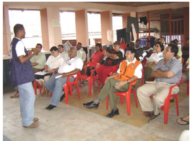
Socialización de los contenidos del Texto y entrega a directores de las instituciones educativas de Tumaco

Tumaco está localizado al Occidente del Departamento de Nariño sobre la Costa Pacífica colombiana, en las coordenadas N 1° 48' 42" y W 78° 46' 08". Este ha sido escenario de dos desastres por terremoto y tsunami, el 31 de enero de 1906 y 12 de diciembre de 1979, que afectaron a Tumaco y a otras poblaciones del Litoral de Nariño. Tumaco es el segundo Puerto sobre el pacífico colombiano después de Buenaventura, cuenta con más de 80.000 habitantes en su área urbana (conformada por un área insular: Isla de Tumaco – la viciosa y la Isla del Morro; y un área continental) y por otros 80.000 habitantes en su área rural.