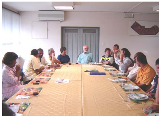
Conferencistas en sala de reunión de la Sociedad Portuaria de Buenaventura

Copia de esta declaración se remite a todas las instituciones participantes en el Primer Encuentro, a las autoridades comunitarias y municipales del Pacífico, gobernadores, corporaciones autónomas, entidades públicas y privadas, nacionales e internacionales.