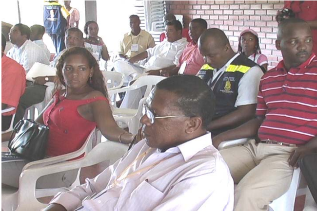
Alcaldes del Litoral Pacífico Colombiano

Los días 30 de junio al 1 de julio se reunieron en el Seminario Casa del Encuentro “Dagnio Regio” en Buenaventura, 14 alcaldes de diferentes municipios de los Departamentos de Valle, Cauca, Nariño y Choco, en el marco de la “Cumbre Nacional de Líderes del Litoral Pacífico Colombiano”. En este evento la “Declaración de Buenaventura”, fue leída, firmada y avalada por los alcaldes asistentes al encuentro, dentro de los cuales estuvieron: Puerto Payan, Condoto, La Tola, Mosquera, Francisco Pizarro, Santa Barbara, Olaya Herrera, Barbacoas, Maguí Payan, Guapi, El Charco y Buenaventura. Este acontecimiento se convierte en una muestra de voluntad política para el fortalecimiento de la gestión de riesgos en el Litoral Pacífico.