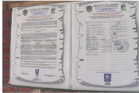
Declaración de Buenaventura, firmada por catorce alcaldes del Litoral Pacífico

El primer “Encuentro sobre gestión de riesgos en el Litoral Pacífico colombiano”, fue apoyado por la Dirección de Prevención y Atención de Desastres de Colombia – DPAD adscrito al Ministerio del Interior y de Justicia y liderado por la Oficina Coordinadora de Prevención y Atención e Desastres de la Alcaldía del Municipio de Buenaventura, con la asesoría del Observatorio Sismológico del Sur Occidente – OSSO, de la Universidad del Valle y la Corporación OSSO. Se contó con la participación de entidades técnico – científicas del orden nacional y regional encargadas de la evaluación de amenazas vulnerabilidades y riesgos como el INGEOMINAS, IDEAM, CCCP, CCO de La Vicepresidencia de la República y OSSO; entidades territoriales nacionales y regionales como el Ministerio de Vivienda, Ambiente y Desarrollo Territorial – MVADT, CVC, CODECHOCÓ, CORPONARIÑO, y Organismos de atención de desastres. Este evento fue patrocinado por diferentes entidades gremiales y académicas, como la Universidad del Pacífico, La Sociedad Portuaria de Buenaventura, Hidropacífico, La Corporación Autónoma del Valle del Cauca - CVC, La Fundación Promotora de la Sociedad Portuaria de Buenaventura – SPRBUN, Confamar, entre otras.